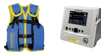
VibraVest Die hochfrequente Vibrations-Weste, Comfort Cough II Hustenassistent optional mit HFCWO