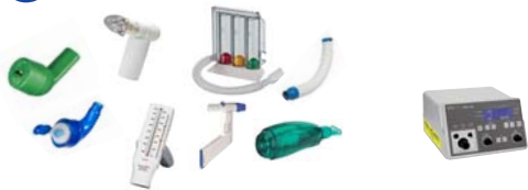
GeloMuc / Flutter / Quake / Cornet / Cornet Plus / Acapella / IPPB Atemtherapie RespiPro / PowerBreathe medic Alpha 300 mit Inhalation