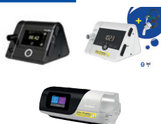
CPAP/autoCPAP/ BiLevel/BiLevel ST/Cheyne Stokes