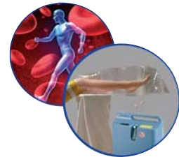
Wundheilung mit Sauerstoff O 2 -TopiCare Wundsystem