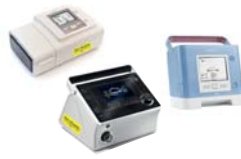
BiPAP A40 Silver Series, Trilogy von Philips Respironics prisma VENT30/40/50-C von LöwensteinMedical