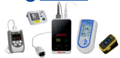
Pulsoxymetrie, Kapnographie, SISS Babycontrol Blutdruckmessung