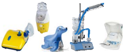
Membran-Vernebler, Ultraschallvernebler, Vernebler mit Schall-Vibration insbesondere für Nasennebenhöhlenentzündung