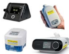
CPAP/autoCPAP/ BiLevel/BiLevel ST/Cheyne Stokes