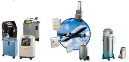
Konzentratoren, stationär + mobil Füllstationen, FlüssigO 2