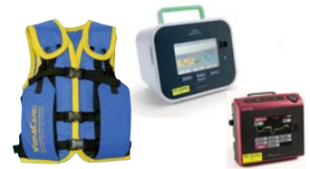
VibraVest Die hochfrequente Vibrations-Weste Pulsar Cough/Cough Assist E70 Hustenassistent mit Vibrationsmodus.