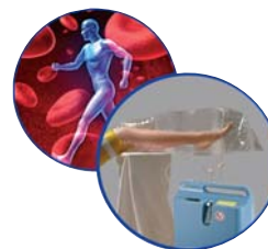
Wundheilung mit Sauerstoff O2-TopiCare Wundsystem