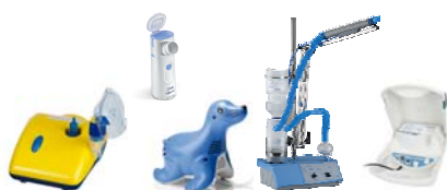
Membran-Vernebler, Ultraschallvernebler, Vernebler mit Schall-Vibration insbesondere für Nasennebenhöhlenentzündung