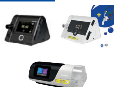
CPAP/autoCPAP/ BiLevel/BiLevel ST/Cheyne Stokes