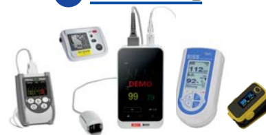
Pulsoxymetrie, Kapnographie, SISS Babycontrol Blutdruckmessung