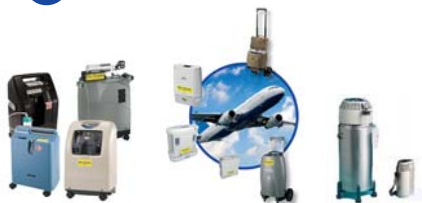
Konzentratoren, stationär + mobil Füllstationen, FlüssigO2