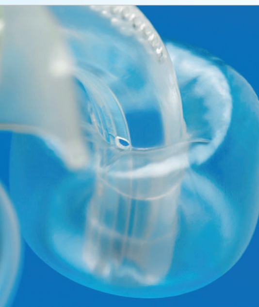
Abb. 1: Beispiel einer Trachealkanüle mit zusätzlichem Absaugkanal mit Öffnung kurz oberhalb des Cuffs.

Naheliegender wäre, von Zeit zu Zeit z. B. per Spritze am Absauganschluss der