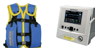
VibraVest Die hochfrequente Vibrations-Weste, Comfort Cough II Hustenassistent optional mit HFCWO